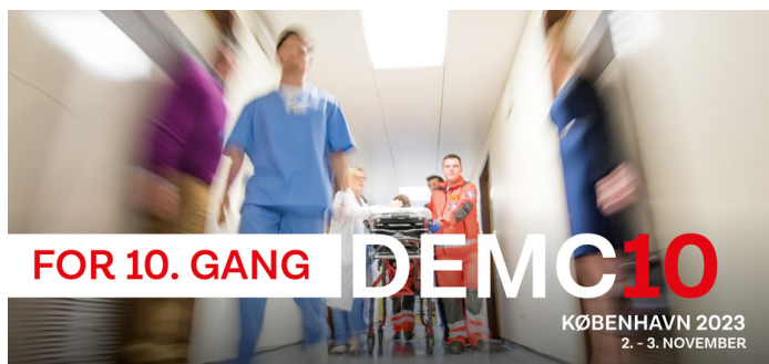
DEMC10 afholdes i november 2023